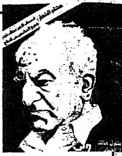
شارل مالك رئيس المجلس الأعلى للثورة الفلسطينية